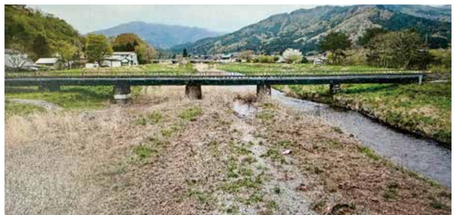
7月5日 市町村要望(山田町の要望箇所)

令和4年度からは、頻繁に発生する洪水による河道の状況変化に応じて、あらかじめ実施箇所を限定せず機動的に対応することとし、令和4年度は約4億円により22河川で、令和5年度は約9億円により37河川で河道掘削等を実施している。