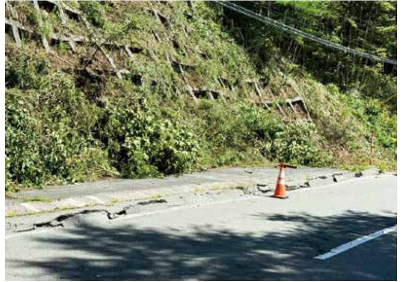
9月5日 455号岩洞湖レストハウス付近通行止め箇所

一方、国道 455 号が重要な路線であることから、今回は、より詳細かつ適時な情報提供を関係市町村から求められた。今後は、地元市町村が必要とする適時な情報や提供方法について確認するなど、平時から市町村との連携を強化する。