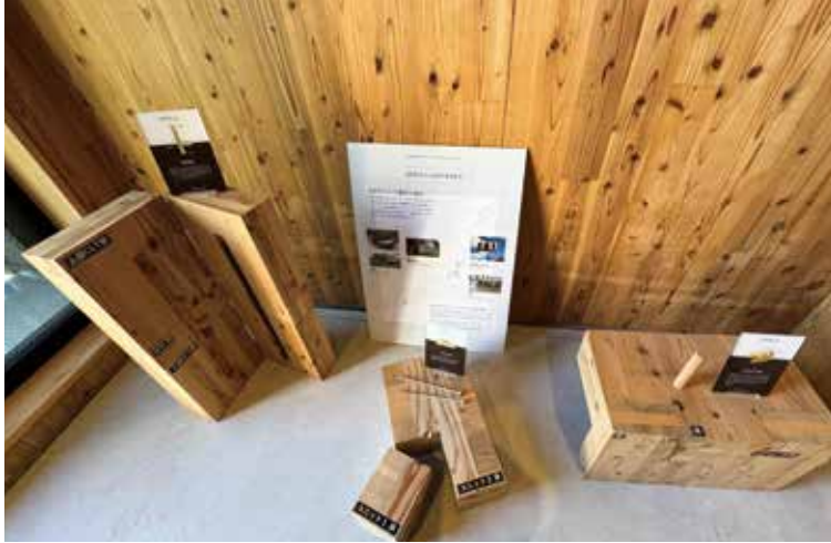
10月29日 森林林業政策研究会視察研修(宮城県) CLT工法

県庁舎の改修・建替に当たっては、脱炭素化に果敢に取り組み、林業に関わる方が誇りを持ち、域内経済を循環し、100年先を見据えた誇りを持てる建物を造るためにも、木質化の可能性を検討すべきと考えるが、知事の考えを伺う。