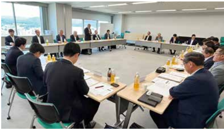
6月8日 自民党県連政策懇談会(商工政治連盟)