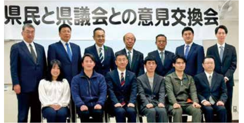
4月23日 県民と県議会との意見交換会

今後においても、隊員や受入市町村の課題把握に努め、研修会の充実や各種交流機会の創出などを通じ、岩手に来ていただく地域おこし協力隊の方々が不安なく、希望を持って活動できるよう、いわて地域おこし協力隊ネットワークを中核とし、様々な関係団体との連携を強化しながら環境整備に取り組んでいく。