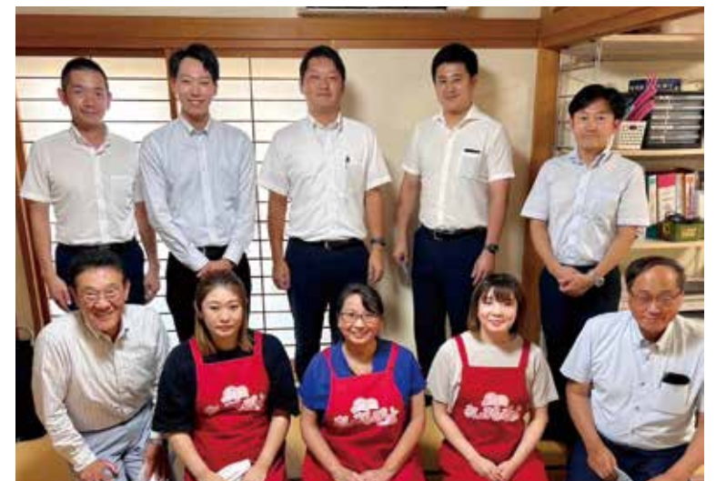
9月12日 政策調査会(まんまるママいわて)

そのため、県としては、医療機関や民間事業者との調整、地域の既存施設の活用や助産師等の人材の確保などの、市町村における産後ケアの提供体制の構築を支援することが重要との考えのもと、市町村の意向を踏まえながら、地域の関係者等とも議論を進め、地域の実情に応じた産後ケアの充実が図られるよう、市町村の取組を支援していく。