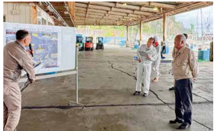
7月19日 漁港健診 太田名部漁港

県では、国に対して、当該制度の柔軟な運用と十分な予算の確保に加え、その見直しに当たっては、漁業関係者への説明や意見交換を行うなど、漁業経営に大きな影響を与えることのないよう、十分な配慮を要望したところであり、今後の国の動向等も注視しながら、漁業経営が安定するよう、取り組んでいく。