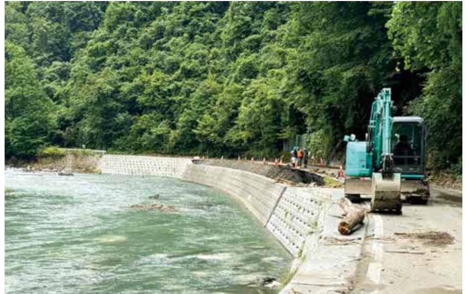
8月16日 県道202号 岩泉町安家

次に、繰り返し被害を受けている箇所に係る災害復旧については、原形復旧を基本としつつ、施設の材質や形状、構造などの質的な改良を施すほか、被害の状況に応じて、抜本的な改良も可能となる改良復旧事業の導入など、国の制度を活用しながら、再度災害防止に取り組んでいるところである。