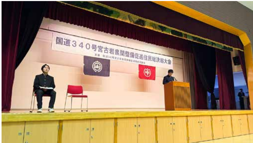
10月12日 国道340号宮古岩泉間整備促進住民総決起大会

未事業化区間約 10 キロメートルについては、まずは、事業中工区（宮古市「和井内～押角工区」、岩泉町「浅内工区」）の早期効果発現が図られるよう、整備に注力したうえで、引き続き、災害に強い道路ネットワークの構築に取り組んでいく。